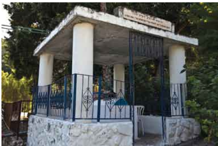
קבר רבי ירמיה

המבנה החדש נבחין בפרט מעניין נוסף: לצדי המרפסות, לכל גובה המבנה, משוכים צינורות לבנים, ה'נבלעים' בקירות המבנה. אלו הם צינורות פלסטיק חלולים העולים מן החלל שמתחת לבניין ופתוחים מלמעלה. תפקידם ההלכתי הוא להוציא את תומאת המתים החוצה אל אוויר העולם, וכך לאפשר גם לכהנים לשהות בשטח המלון.