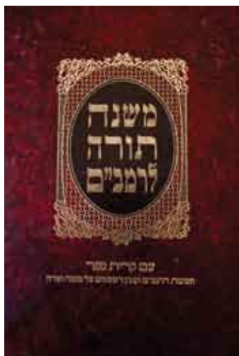
שער ספר משנה תורה לרמב"ם

השל"ה הקדוש הוא כינויו של רבי ישעיה הורוביץ (1558-1630), על שם ספרו החשוב ביותר 'שני לוחות הברית' העוסק בחידושי תורה ומוסר. השל"ה נולד בפראג ושימש בתפקידים רבניים בקהילות רבות עד לעלייתו לארץ ישראל שבה גם נקבר.