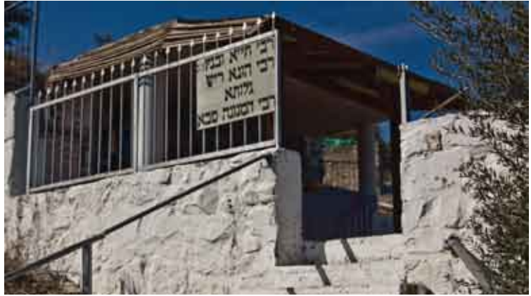
קבר רבי חייא רבה