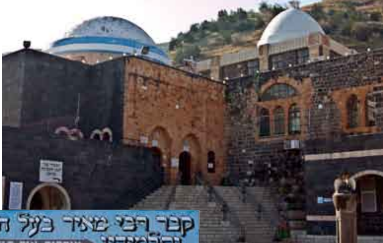
קבר רבי מאיר בעל הנס ותלמידיו Rabbi Meir Ba'al Ha'ness & his pupils' Tomb

הראשון המכנה במפורש את רבי מאיר כאן בטבריה בכינוי 'בעל הנס' הוא רבי חיים אבולעפיה באמצע המאה השמונה עשרה, ומאז הוא נודע בראשי התיבות 'רמב"ה' או רמבעה"ן. אך מיהו רבי מאיר ומהו ה'נס' שנוסף לשמו?