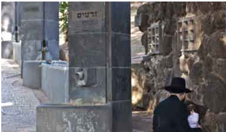
בכניסה לקבר הרמב"ם